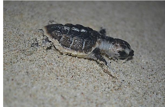
شکل ۱: لاک‌پشت منقار عقابی نابالغ

را گونه‌های مختلف اسفنج و ۵٪ را طیف متنوعی از بی‌مهرگان کفزی، جلبک‌ها و گیاهان دریایی تشکیل می‌دهد (کریمی‌نیا و همکاران، ۱۳۸۸).